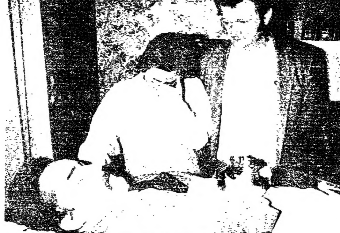
الطفل تحول إلى قتل برنار لاروش مسجى وزوجته نانسى